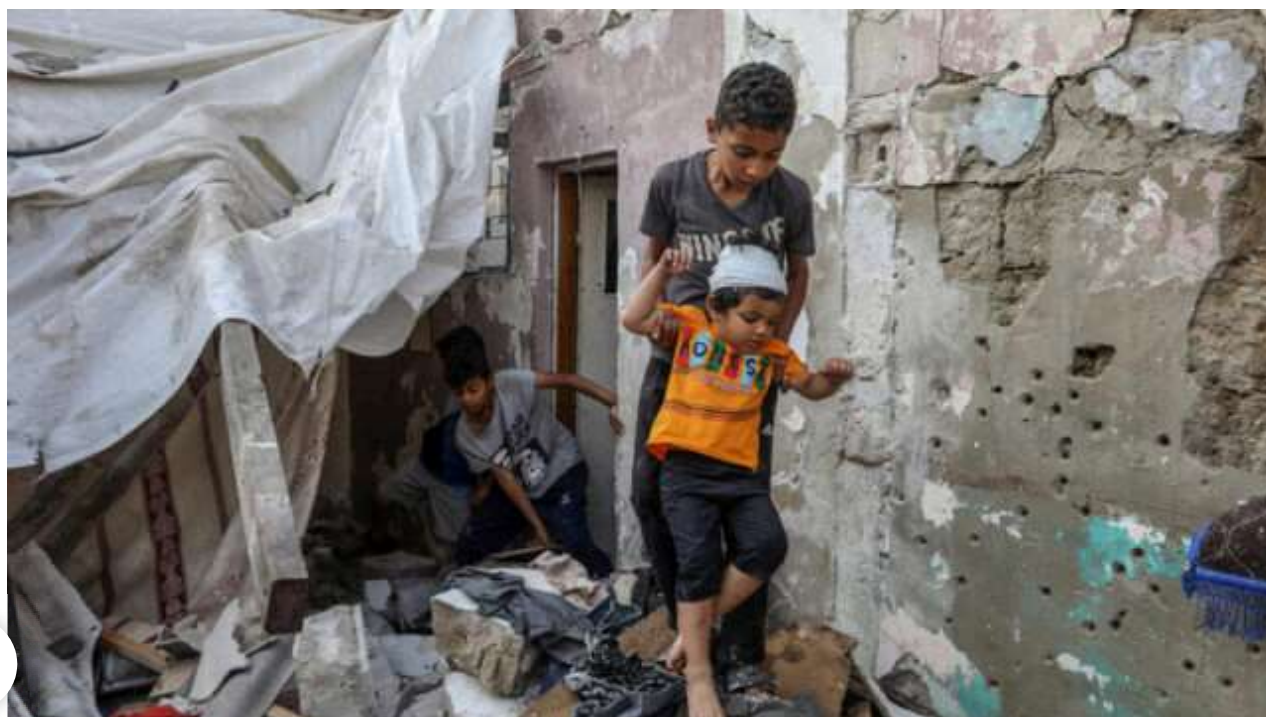
פלסטינים באתר בית שנהרס בתקיפה אווירית ישראלית ברפיח, דרום רצועת עזה, 1 במאי 2024.